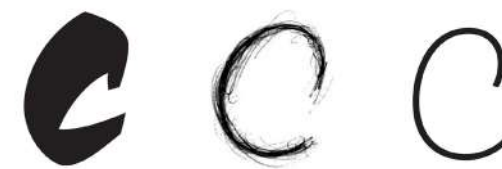
Choc's c, first sketch for Arlette, final c of Arlette Thin.

Arlette (อาร์เล็ทต์) also covers Thai, we took the same fast stroke curves and extravagance from the Latin, which adapted naturally to the Thai. We also adapted the idea of the swashes to this writing system, looking for a similar feature in the handwritten palm leaves where some of the characters have a decorative flair. Arlette (อาร์เล็ทต์) Thai has a set of alternate characters inspired by those handwritten forms.